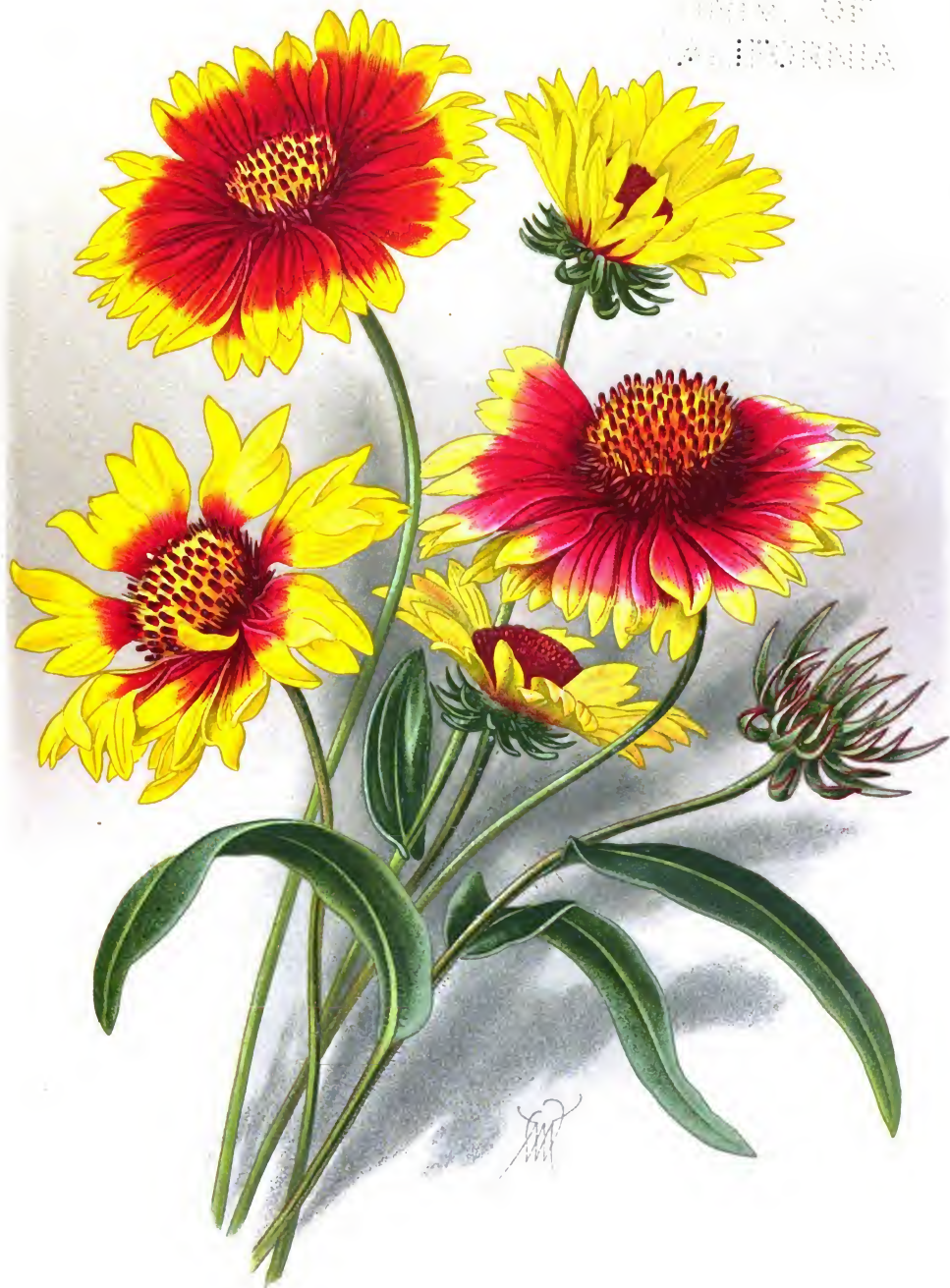
Gaillardia hybrida Hort.